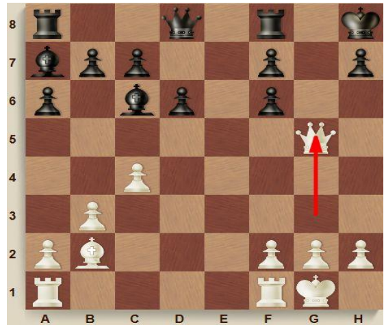
А. Жертва ферзя